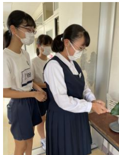
アルコールディスペンサー

また、 発熱または風邪の症状(発熱、のどの痛み、咳、下痢)や、全身倦怠感、嗅覚・味覚異常を理由にして学校を欠席している兄弟姉妹や、お仕事をお休みしている方がご家庭内にいる場合は、お子様自身が元気であっても登校を見合わせ、自宅で休養させてください。 その場合は、「欠席」とはならず「 出席停止 」扱いとなります。ご不明な点等ある場合は、学級担任等にお問い合わせください。